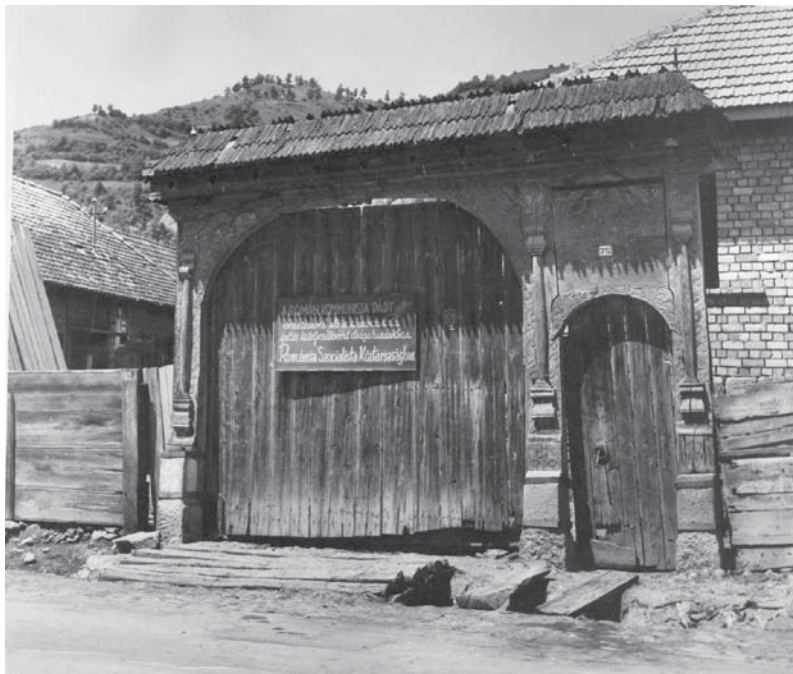
Székelykapu Máréfalván – a Román Kommunista Párt dicsőítésére

Vincze Gábor (szerk.): Történeti kényszerpályák – kisebbségi realpolitikák II. Pro-print, Csíkszereda, 2003. 251.