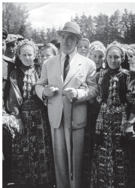
Petru Groza a Magyar Népi Szövetség küldöttjei között, 1945