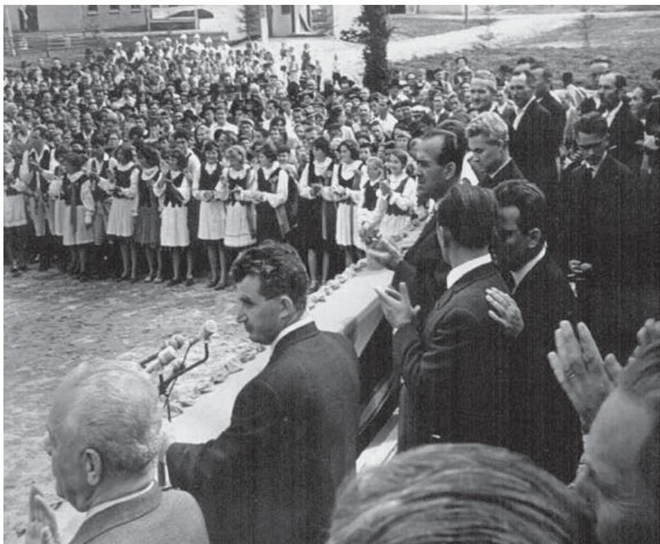
Nicolae Ceaușescu látogatása Székelyföldön, 1966