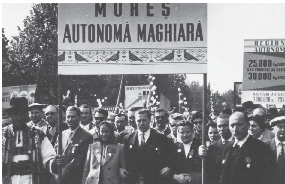
Ünnepi felvonulók a Maros-Magyar Autonóm Tartományból

1958. február 23–28. A Kádár János vezette magyar kormány- és pártdelegáció Romániába látogat. Marosvásárhelyen Kállai Gyula miniszterelnök magyar nemzetiségű