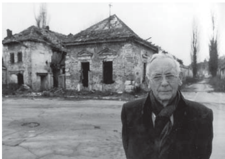
Max van der Stoep, az EBESZ első Nemzeti Kisebbségek főbiztosa Horvátországban, 1995