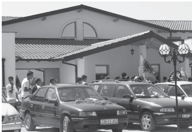
Kosovói albán fiatalok

Max van der Stoep: Peace and Stability through Human and Minority Rights . Baden-Baden, Nomos, 1997. 37.