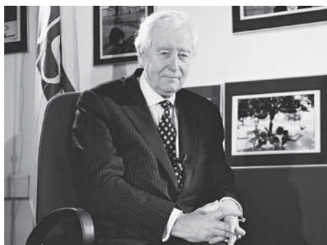
Rolf Ekeus főbiztos

Ennek ellenére sem a keretegyezmény, sem a nyelvi karta nem határozza meg kizárólagosan és egyértelműen, mit kell tennie egy államnak, milyen jogokat kell a kisebbségei számára biztosítani ahhoz, hogy azok kisebbségi identitásukat megőrizhessék. Nehézséget okoz az is, hogy ezeknek az egyezményeknek a végrehajtását csak szakértői testületek ellenőrzik, s amennyiben egy állam megsérti kisebbségeinek jogait, nem lehet nemzetközi bírósághoz fordulni.