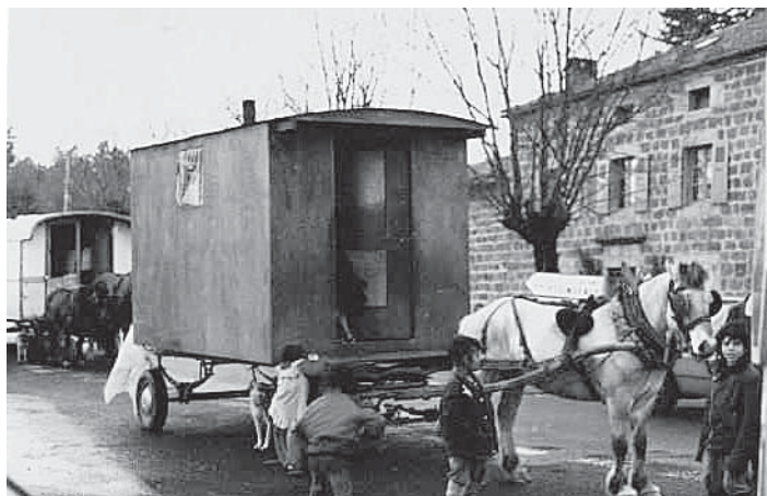
Vándorcigányok Franciaország útjain

is komoly figyelmet szentelt a közép- és kelet-európai kisebbségeknek. Az európai nemzetközi szervezetek közül politikailag és gazdaságilag legjelentősebb Európai Unió az 1993-as koppenhágai csúcstalálkozón döntött a közép- és kelet-európai államok felvételének követelményeiről.