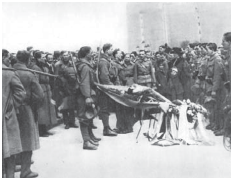
A Székely Hadosztály eskütétele a Parlament előtt 1919 elején

Velük szemben csak a megszállt területekről menekültekből szerveződő Székely Hadosztály képezett ellensúlyt. Károlyi Mihály január végén az addigi tapasztalatok nyomán már a fegyveres honvédelem mellett döntött, de ehhez továbbra sem állt rendelkezésre megfelelő haderő. Ebben a helyzetben a békekonferencia azon döntését, hogy a román csapatok a Szatmárnémeti–Arad vonalig vonulhatnak előre és ettől nyugatra egy semleges zónát hoznak létre, amelybe Debrecen, Békéscsaba, Szeged is beleesett volna, már nem tudta elfogadni. Az addigi antant együttműködési politika kudarca nyomán Károlyi lemondott. Az ország integritásának megőrzése érdekében egyetlen lehetőségként a Szovjet-Oroszország felé orientálódó külpolitika maradt.