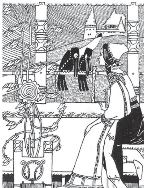
Kós Károly rajza: Ének Attila királyról