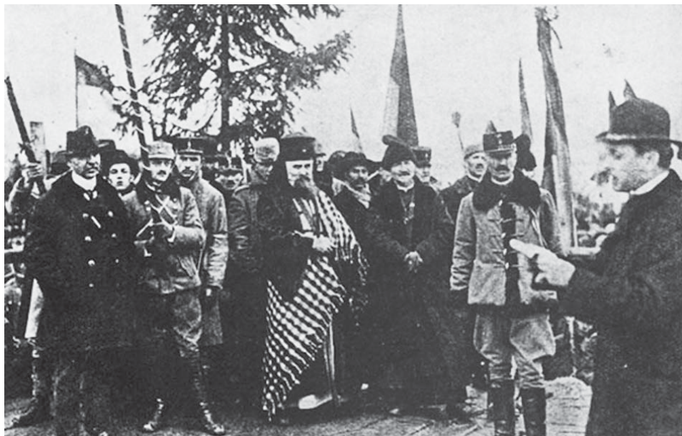
A gyulafehérvári román nemzetgyűlés határozatainak felolvasása

A Román Nemzeti Tanács (RNT) november 9-én Aradról ultimátumot intézett a kormányhoz, amelyben Kelet-Magyarország 26 románok lakta megyéje feletti hatalom átadását kérte. Mindezt a wilsoni önrendelkezés elvére és a közbiztonság megőrzésére hivatkozva tette. Az ezt követő, Jászi Oszkár