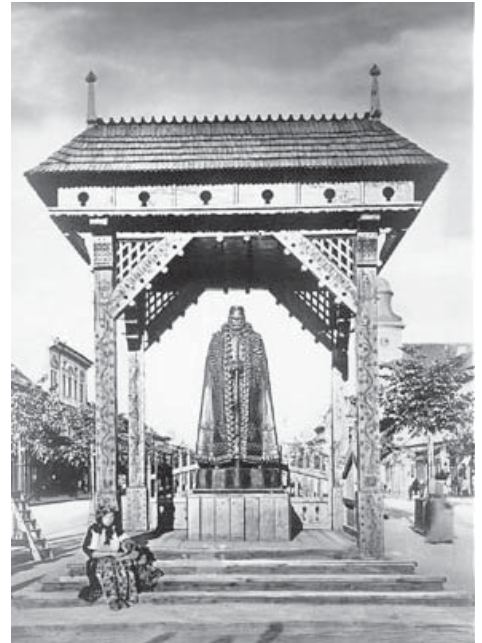
A kolozsvári Kárpátok Óre szobor

Az egységes érdekképviselet létrehozása a diszkriminatív román nemzetiségpolitikával szemben elkerülhetetlen volt. 1921 tavaszán a magyar egyházfők is letették a hűség esküt. Mivel a Romániához került magyarságnak ez volt az egyedül megmaradt, az egész társadalmat lefedő intézményrendszere, politikai képviseletét biztosítani kellett. Itt elsősorban az oktatási és a földbirtokreformhoz kapcsolódó sérelmekről volt szó, és ennek parlamenti képviselete elengedhetetlen volt. A parlamenti képviselet megszerzéséhez pedig politikai pártként részt kellett venni a választásokon. 1921 nyarán az „aktivisták” létrehozták a Magyar Néppártot, majd júliusban ennek integrálása érdekében a „passzivisták” egyesültek a néppártiakkal a Magyar Szövetségben, amelyet báró Jósika Samu, a magyar főrendiház utolsó elnöke (a legmagasabb rangú erdélyi méltóság) vezetett. A Szövetség a romániai magyarság közjogi személyisége (mint önkormányzata) képviselőjének tekintette magát. Ezért a kormányzat, más mondva csinált indokokra hivatkozva 1921 októberében a szervezet működését felfüggesztette. Az 1922-ben várható választásokra előbb januárban a Néppárt, majd februárban Grandpierrék Magyar Nemzeti Pártként újrászervezték magukat, de megegyeztek a közös jelöltekben. Ez azonban nem segített abban, hogy a magyarság jelentős része nem szerepelt a választói névjegyzékben, illetve a magyar jelöltek döntő többségét a legkülönbözőbb kifogásokkal fel sem vették a választási listára. Ilyen és