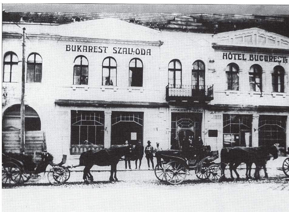
Székelyudvarhelyen a volt Budapest Szálló az impériumváltás után

ha az demokratizálódása során nemzeti autonómiát ad az oda csatolt magyar közösségnek. Ennek az eszmekörnek meghatározó képviselője volt Kós Károly építész és Paál Árpád újságíró (volt udvarhelyi alispánt, aki letette a hűségesküt a megyei tisztviselőkkel a Székely Köztársaságra, majd másfél éves börtönbüntetést szenvedett). 1921–1922-ben lényegében ez a két csoport – a pozícióörző, hagyományos erdélyi magyar elit (beleértve az egyházak vezetőit) és a sajtónyilvánosságot meghatározó, a demokratikus önszerveződést, a politikai, gazdasági, társadalmi