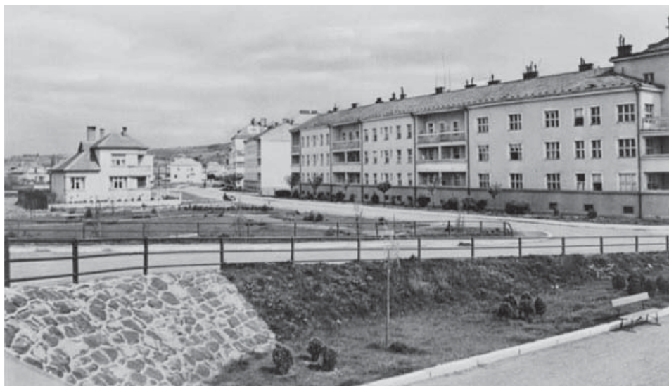
Az ungvári Galagó városnegyed

ez volt a történelmi Magyarország, s utána is az egész kelet-közép-európai térség legelmaradottabb szeglete. Így volt ez annak ellenére, hogy a csehszlovák időszakban sikerült csökkenteni az analfabetizmust. Nem hozta meg viszont a kívánt eredményt a földreform. A hivatalnokréteg szinte kizárólag bevándorló csehekől alakult ki. A régi nagybirtokokon ún. cseh telepeket hoztak létre. A lakosság közel 70 százaléka a mező- és erdőgazdaságban volt foglalkoztatva, alig volt ipar, kézműipar (10% körül), kereskedelem (5% körül). Nagy hagyománya volt a borászatnak és a méhészetnek. Állandó problémát jelentettek az árvizek, különösen nagy volt a pusztítás 1933-ban.