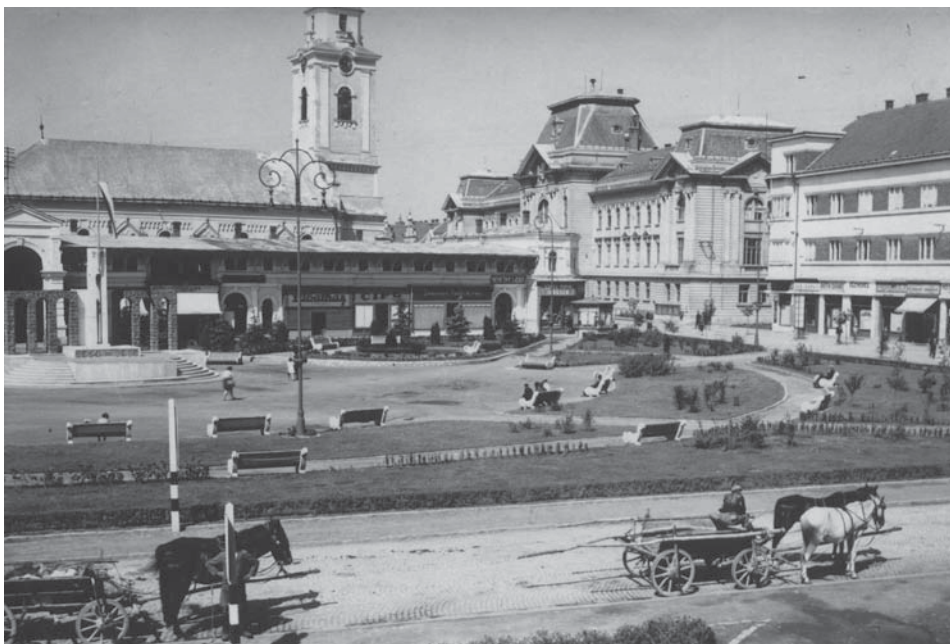
Beregszász főtere a református templommal

Fáby Zoltán: Az éhség legendája. Kárpátalja: 1932. Kárpátaljai riport. Az Út kiskönyvtára 4. Mező István szenátor kiadása. Pozsony, 1932. 3., 6., 13.