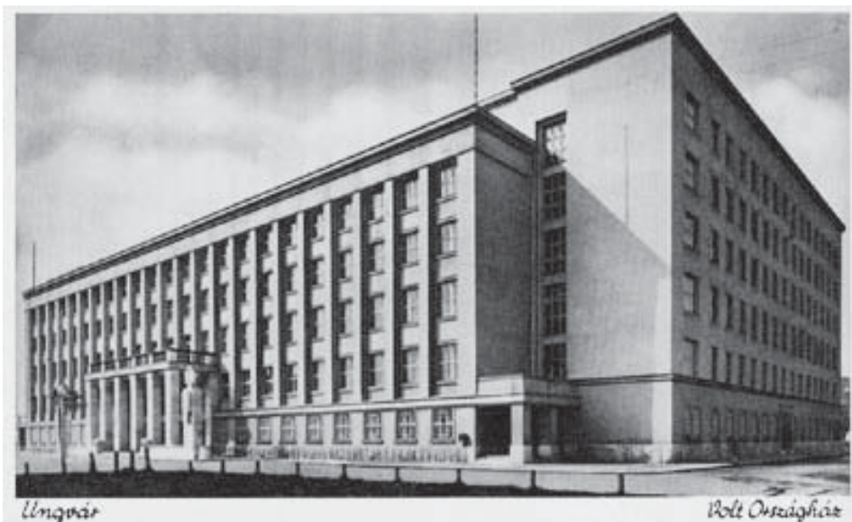
Az ungvári kormányzósági palota épülete

A hivatalos magyarázatok az autonómia halogatásával kapcsolatban többnyire arról szóltak, hogy az itt tapasztalható elmaradottság, szegénység miatt az lehetetlen. A szegénység felszámolására a századfordulón tetek kísérletet az ún. hegyvidéki akció keretében Egan Ede vezetésével. Tény, hogy 1918 előtt