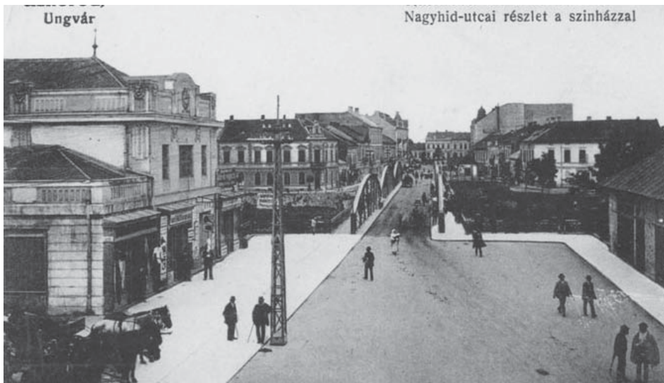
Az ungvári színház

Ruszinszktói Magyar Hírlap, 1927. január 16.