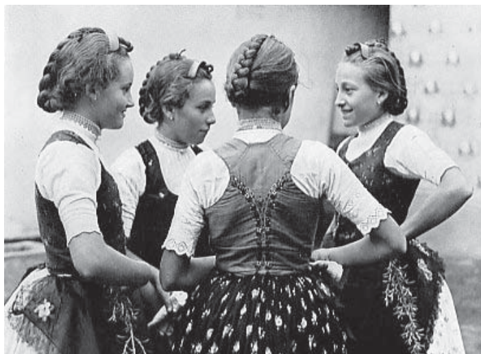
Bánáti sváb lányok az 1940-es években

igyekezett megakadályozni a helyi magyarok közigazgatásból történő kiszorítását. Megpróbálták azt is elérni Berlinben, hogy Magyarországról szakképzett közigazgatási tisztviselőket küldhesse- nek a Bánátba. Ezt a kérést a német külügyminisztérium azzal utasította vissza, hogy a hivatali állások betöltésénél a helyi magyar népcsoport olyan része-