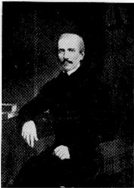
Gróf Kemény József 1795—1855

Ilyen bevezetés után a kérdés eszmei része már tisztázott volt, mikor az erdélyi országgyűlés 1842. június 21-én történt megnyitásakor a rendek elnöke az ülés elején ismertette gróf Kemény József és Sámuel levelét. Az általános tetszésnyilvánítás, éljenzés és a felszólalások sora, amely e bejelentést követte, és még inkább az, hogy a lelkes fogadtatás egy olyan testületben történt, melynek tetszésnyilvánító tagjai közül csak nagyon kevesen láthatták be egy könyvtár és múzeum megalapításának közművelődési, illetőleg tudományos jelentőségét, mindez, mondom, nyilvánvalóan mutatta, hogy a rendek egy ilyen intézmény megalakítását elsősorban politikai sikernek tekintenék. Mutatta ezt az is, hogy a felszólalók között Zeyk János , Doboka megye követe az ajánlás napját azért tartotta nevezetesebbnek, mert ezáltal az eddig folytatott sérelmi politikától eltérve, az országgyűlés a haladás útján az alkotások mezejére lép. De volt olyan is, Pálffy János , Udvarhelyszék követe, aki nem elégedett meg a múzeum felállításának gondolatával, hanem a XVI. századi Sodalitas Septem-castrensis tervével megindított tudós társasági törekvések megvalósításaként egyebek mellett egy erdélyi tudományos akadémia felállítását sürgette. Az ilyen távoli célokra néző hozzászólót azonban az akkori szűkös erdélyi lehetőségeket hidegen mérlegelő felszólalók figyelmeztették arra, hogy a nagyarányú akadémiai megoldás helyett a