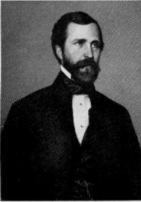
Kővári László 1820—1907

kivívható múzeum felállítását kell mindenképpen szorgalmazni. Az országgyűlés magyar része szinte egyhangúan a múzeumalapítás gondolatához szegődött. Végre 1842. december 23-án az országgyűlés a rendszeres bizottmány előzetes tárgyalásai nyomán elkészült javaslatot elfogadta és az országos tanácskozó-terem építése és a nemzeti színház támogatása mellett elhatározta a múzeum alapítását is. A múzeum megszervezésére 100.000 forintot irányoztak elő. Mikor azonban a múzeumnak országos rovatal útján való megalapítására terelődött a tárgyalás sora, az addig egykedvűen viselkedő szászok hevesen elleneztek azt, hogy országos múzeumot állítsanak fel és még inkább azt, hogy annak fenntartására reájuk is vessenek ki rovatalt. A szászoknak ugyanis nem volt nemzeti érdekük, hogy a szász népi tömegektől távol