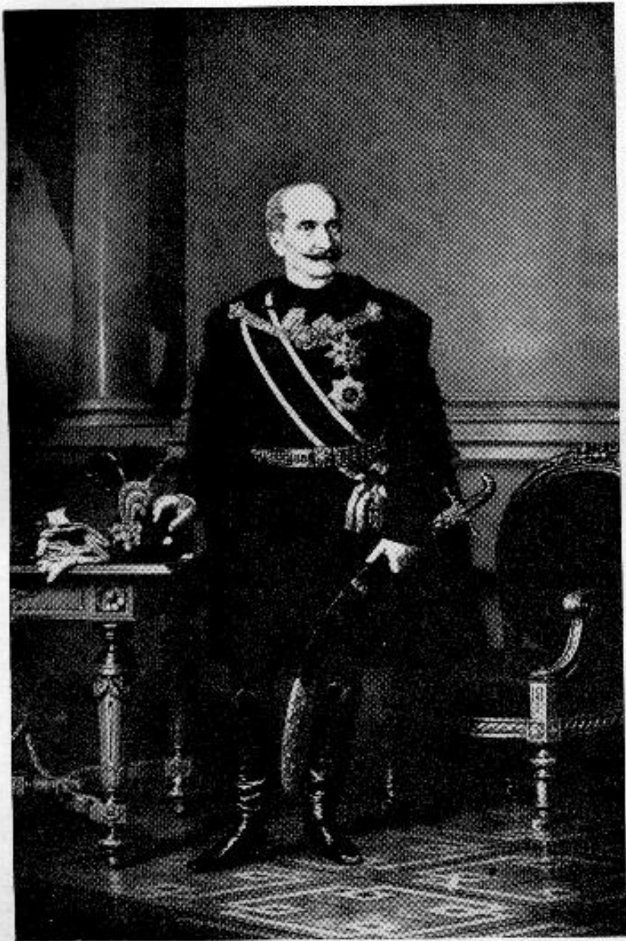
Gróf Mikó Imre 1805—1876