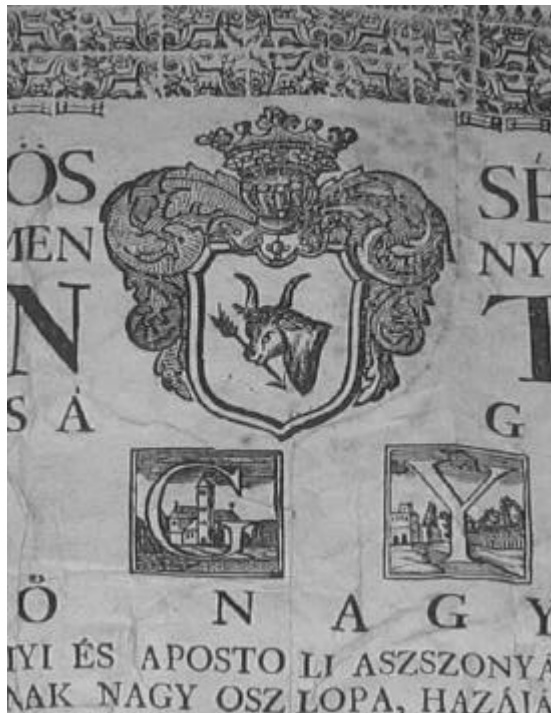
14. kép. Wass György (1704–1777) halotti kártája (részlet)

sakdísz között helyezkedik el. A 18. század elterjedt gyakorlatához híven gyöngyökben végzodik, és a grófi címnek megfelelően kilencágú (bár az ágak száma a 18. században olykor ingadozó, és ettől eltérő, következetlen használatra is van példa). 50 A korona ágaira van tűzve a három sisak, amelyek számát – külföldi mintára – ugyancsak a grófi cím határozta meg. Maga a címer a klasszikus heraldika szabályait már figyelmen kívül hagyja: szín színen jelenik meg, a pajzs többszörösen osztott, a címerképek nem stilizáltak. Utóbbi egyben magyar sajátosság: a címerképek természetesen megfestett alakokat ábrázolnak (medvefo, kecske, szarvas, vitéz), és ennek a természetességre való törekvésnek jele a felhozott kék ég a háttérben. A magyar családi címerek nagy többségéhez hasonlóan segédsisakdíszként a kar szerepel. A lebege címer alatt kockázott padlózat, mögötte fantázia szülte tájkép és kék ég, a keretet alkotó, arannyal díszített bordó drapérián pedig Magyarország, Csehország, Dalmácia és Horvátország, a fohelyen pedig Erdély címere látható. A hártafüzet