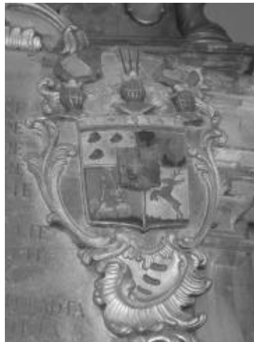
8. kép. Magyargyeromonostori br. Kemény Simonné Wass Kata (†1783) címere a marosvécsi templomban lévő építési emléktáblán 1770-ból

Dániel megadományozott fiai közül a legidősebbik, Miklós (1. kép), 1701. május 31-én született 4 és 1769. október 26-án halt meg 5 Cegén temették el december 10-én. 6 A kolozsvári református kollégiumban tanult, 7 majd később a birtokain gazdálkodott és a megyei nemesség meglehetősen egyhangú életét élte, közszereplést nem vállalt. Elso felesége széki gr. Teleki Éva volt, 8 ennek halála után újranősült és losonci br. Bánffy Krisztinát 9 vette el. Még 1744 előtt királyi tanácsosi címet kapott, amivel nyilván nagyon meg lehetett elégedve. Rettegi György (1718–1786), a Doboka vármegyei naplóíró kisnemes szerint ugyanis címének „nagyon örült és ritkán subscribalt [=írt alá], hogy oda ne tegye: Felső Asszonyunk C(onsilia)riusa. Utoljára „Crius”-nak hívták volt”, jegyezte meg némi gúnnyal Rettegi, aki nemigen kedvelte, mert egy korábbi szívességét elmulasztotta viszonzni és emiatt a róla írt jellemzése cseppet sem hízelgo: „Pénzes ember volt szegény, de amellet szegény is; hathatósan tudta az embert szóval lactálni [=ámítani], valósággal nem igen. [...] Hetven esztendos ember, de se hajában, se szakállában osz nem volt. Magas, száraz, sok beszédu