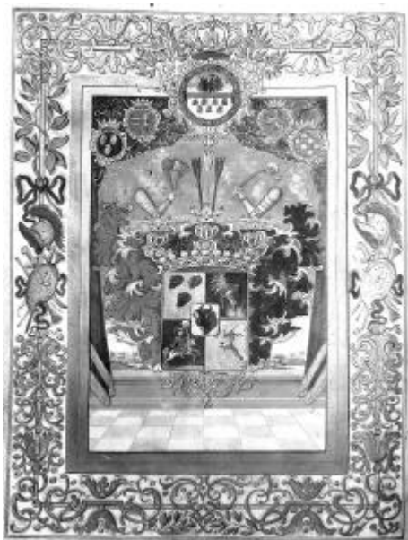
6. kép. A Wass család bővített címere 1744-ből (ENMLt, Wass Otília hagyatéka, 234. sz.)

vármegyei ülnök, 1688–1691 között császári csapatok mellé rendelt hadi biztos, majd 1691 tavaszán Szebenben számvevo. Bánffy György (1660–1708) gubernátor megbízásából, ennek bizalmasaként újból hadi biztos az 1695. évi hadjáratban Veterani császári tábornok mellett. Az erdélyi rendek megbízásából háromszor járt követségben