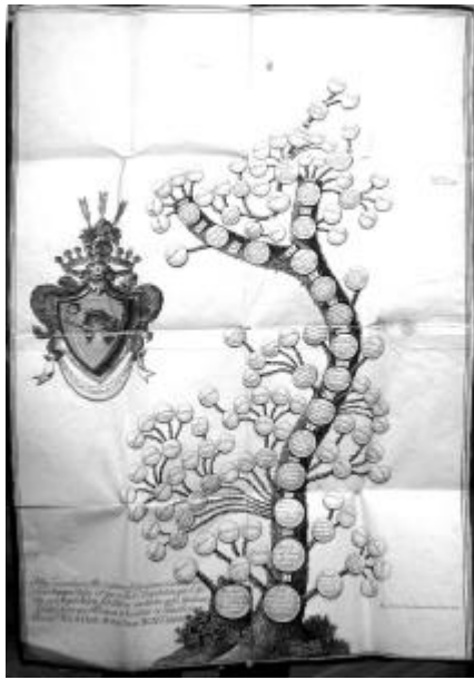
9. kép. A Wass család díszes kiállítású családfája 1822-ből (Wass cs lt, 41. doboz, 5343. sz.)

s szóval sokat ígéro, keveset teljesítő ember volt szegény.” 10 Nyolc gyermeke 11 közül csak három érte meg a felnőttkort, az egyetlen fiú, Farkas (1769–1795) 12 pedig utód nélkül halt el.