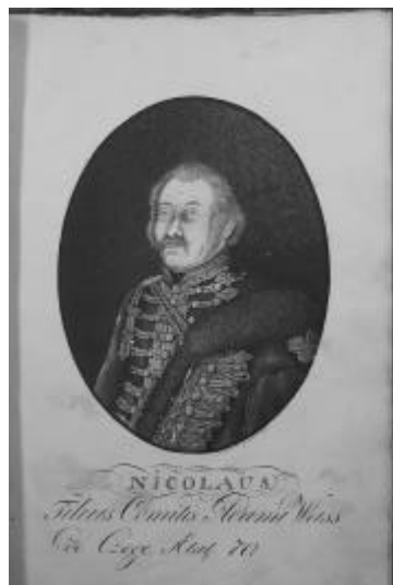
11. kép. Wass Miklós (1744–1829) arcképe (Huszti: Genealogia heroica 87)

már a 14. századtól, bár a címerhasználat a vidéki magyar nemesség körében ekkoriban alig volt elterjedve és pecsétnyomóikra is még csak különböző jelképeket vésettek (csillag, kereszt, félhold, virág, kardot tartó kar stb.). 35 A címereket kezdetben viselőjük maga választhatta meg, a felvett címet pedig a használat erősítette meg, de valamikor a 14. században a címerválasztás és -használat mindinkább írásba foglalt adománnyá és az uralkodó kizárólagos jogává vált. 36 A középkori címeres emlékek leginkább pecsétlenyomatokon, kisebb mértékben sírköveken maradtak fenn; a Wassok esetében az első ilyen emlék 1361-ből való, és Wass Miklós dobokai ispán gyuruspecsétjének lenyomatán látható. A pajzsban levo ábrázolás – a viaszlenyomat kopottsága miatt – nem értelmezhető pontosan, megeshet azonban, hogy a címerben később is szereplő bölényfejet mintázta (4. kép). 37 A következő címeres pecsétlenyomat 1511-ből ismeretes, és szentegyházi Wass Jánosnak két másik társával együtt kiállított fogott bírói oklevelén maradt fenn. Ezen világosan felismerhető a nyíllal átlott bölényfej (5. kép). 38 Ugyanez a bölényfej