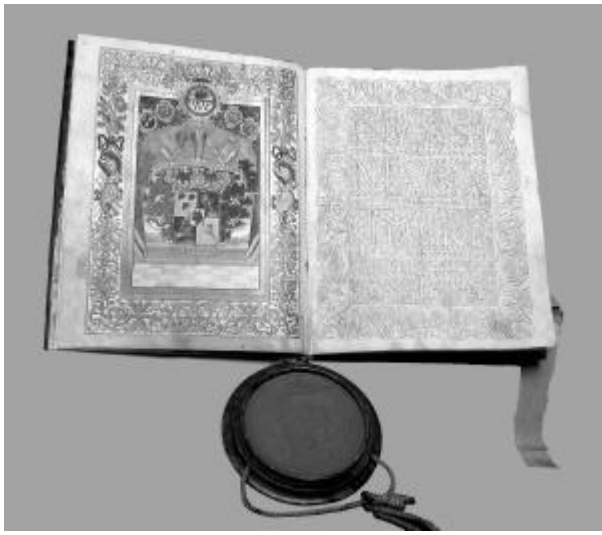
7. kép. A Wass család grófi diplomája 1744-ből (ENMLt, Wass Otília hagyatéka, 234. sz.)

temették el a cegei kápolnában. 13 1690-ben csatlakozott Thököly Imre (1657–1705) mozgalomához, 14 1698-ban királyi hivatalos az országgyűlésen, 15 1699-ben a román papok állapotát vizsgáló császári bizottság tagja. 16 A kuruc szabadságharc elején, 1704-ben a császárhoz nemességgel együtt Szebenben rekedt, 17 szabadulása után azonban Rákóczi mellé állt. Katonaként főkaptányi rangot ért el, 18 csapataival többször járt Máramarosban. 19 1707-től – valószínűleg 1711-ig – Doboka vármegye, 20 1708-ban pedig Belso-Szolnok vármegye foispánja. 21 A szatmári béke egyik aláírója 1711-ben 22 a