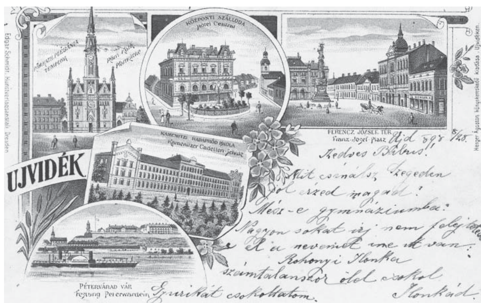
Újvidék 1920 körül

A Nemzeti Igazgatóság, a belgrádi katonai konvenció előírása ellenére, azonnal megkezdte a magyar főispánok, alispánok, polgármesterek, jegyzők, a megyei és községi tisztviselők elbocsátását , és helyükbe szakképzetlen, de „államhűségi” szempontból megbízható, gyakran korrump, főként szerb tisztviselőket ültetett. A régi magyar bírák,