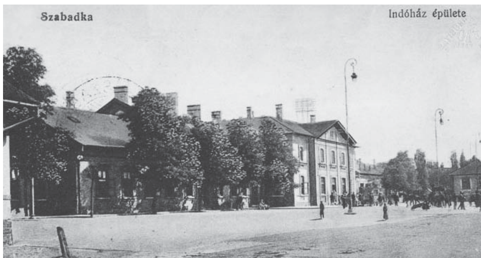
A szabadkai vasútállomás épülete

ügyesek engedetlensége miatt a polgári peres ügyek vitelére kezdetben szerb katonai bíróságokat állítottak fel. Bevezették a cenzúrát, betiltották a magyar nyelvű színházak működését, a magyar nyelvű filmek vetítését, a „megbízhatatlan elemek” összejövetelét, beleértve a családi összejöveteleket is. Kijárási tilalmat vezettek be, rendőri felügyelet alá helyezték az osztrák-magyar hadsereg volt tisztjeit, és tömegesen, minden vagyonuktól megfosztva dobták át a határon a hűségeskü megtagadó tisztviselőket, tanítókat és tanárokat. Nem volt ritka a helyi lakosság és szerb katonaság közötti fegyveres összetűzés sem.