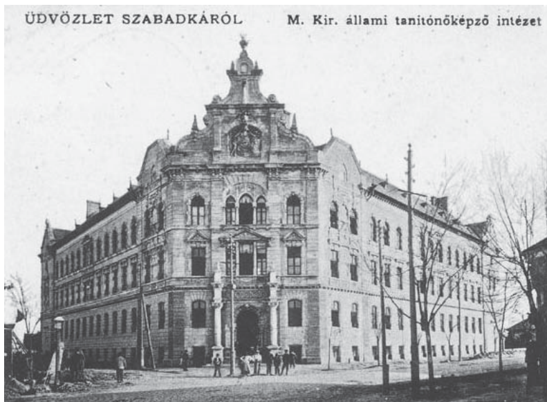
A szabadkai Tanítóképző épülete

1918 őszétől megkezdődött a gazdasági élet nacionalizálása, az „idegen” vagonok zár alá helyezése , és egy máig ismeretlen rendeletre hivatkozva a helyi magyar tulajdonosokat is arra kötelezték, hogy vállalataik igazgató tanácsába „megbízható szerbeket” válasszanak.