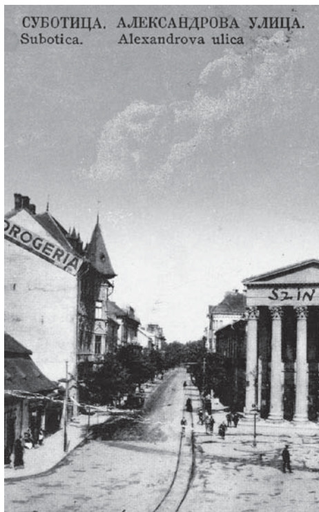
Szabadka 1920 körül

Magyar Országos Levéltár (MOL) A miniszterelnökség központilag iktatott és irattározott iratai. A II. osztály iratai. K-26–1920-XLI-994–7645.