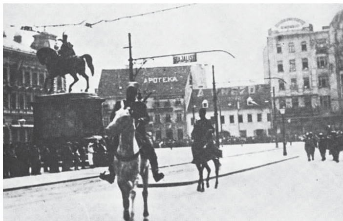
Az új királyság katonái a zágrábi Jellačić téren

1922. július 26. A jugoszláviai magyarok optálási jogának (az állampolgárság megválasztásának joga) lejárt. Akik nem akartak áttelepülni Magyarországra, azok ettől kezdve gyakorolhatták jugoszláv állampolgári jogukat.