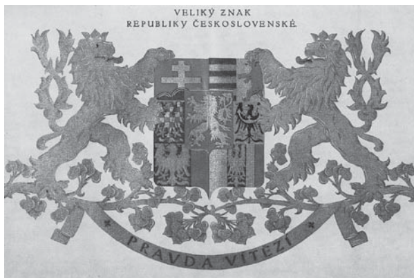
A Csehszlovák Köztársaság nagy címere

Popély Gyula: Adalékok a „csehszlovák demokrácia” arculatához az impériumváltás után. http://home.nextra.sk/madszu/szemle3.htm