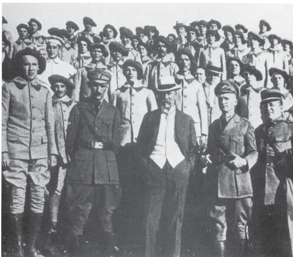
T. G. Masaryk csehszlovák elnök a cseh légió katonái közt

Az Itáliából hazarendelt cseh légiók Szlovákia déli, magyarok által lakott területeit szilveszter napján kezdték megszállni és január közepére vették birtokukba. Mivel a helyi lakosság a csehszlovák állam fennhatóságát csupán átmeneti jellegűnek tartotta, a bevonuló cseh katonákat békésen fogadta. Fegyveres ellenállásra csupán néhány helyen, így Érsekújvár környékén, vagy a mátyusföldi Deáki és Pered községeknél került sor, ahol a helyi lakosságból létrehozott nemzetőrség megpróbálta feltartóztatni