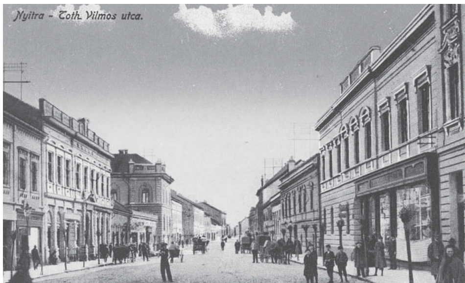
Városok a nyelvhatáron: Nagyszombat és Nyitra