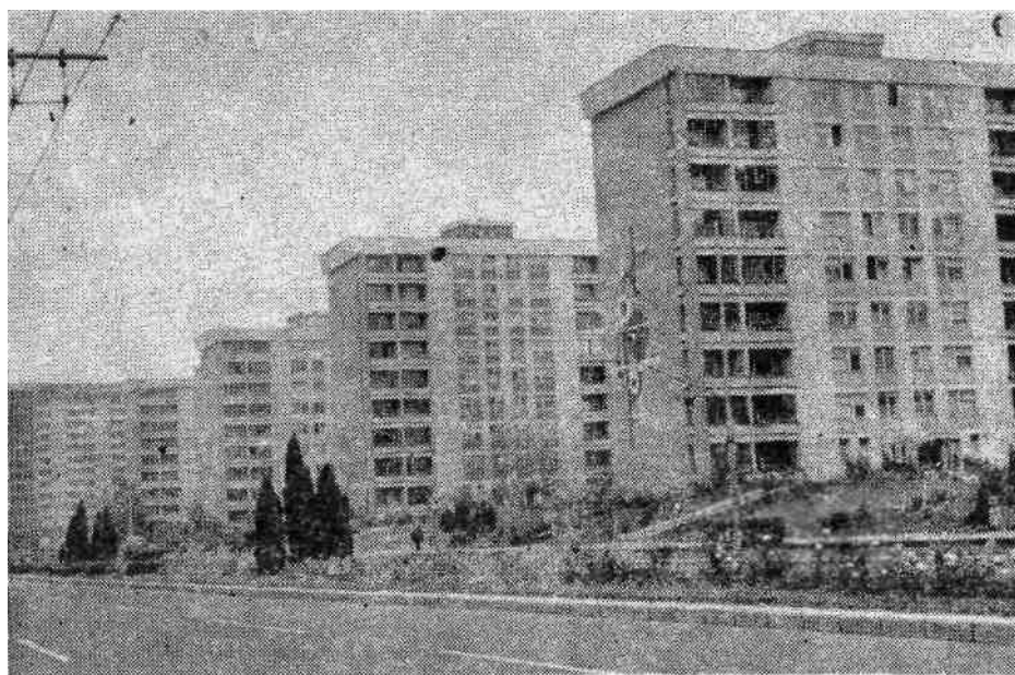
... a város főleg tömbházakkal gyarapodik

foglalkozási szempontból egyaránt mozgékonyabb népességnél — a hagyományos szemléletkorlátok felszakadozása és az egyre inkább munkahelyszférájú párválasztás miatt — a homogén házasságokkal szemben erősen teret hódít a heterogén, interetnikus házasságok száma. Vetési „mintavétele” már csak azért is további, szélesebb kört felölelő kutatásokra ösztönöz, mert köztudomásúlag a magyar etnosz mintegy negyedrésze (kb. 400 000 lélek) él interetnikus diaszpórában, az összlakosságnak mindössze 5—15 százalékát képviselve. Ugyanakkor a hagyományos életmódot folytató magyar ajkúak száma — amint az a népszámlálási adatokból is kiderült — az országos átlagnál gyorsabb ütemben csökken. 1966-ban 718 475 magát magyar nemzetiségűnek valló személy lakott városi környezetben és 41 443 a városokhoz csatolt peremközségekben. A falun lakó magyarok száma 859 674 volt. Tizenegy esztendővel később 141 208 személlyel nőtt a városokban (+19,7 százalék) és 229 lélekkel (+0,1 százalék) a peremközségekben élő magyarság száma — ami nem éri el az országos növekedési átlagot —, de 54 155 személlyel (—6,3 százalék) csökkent a falun élőké. A hagyományos keretekből kilépő magyarság számaránya tehát mintegy másfélszerese az országos értéknek.