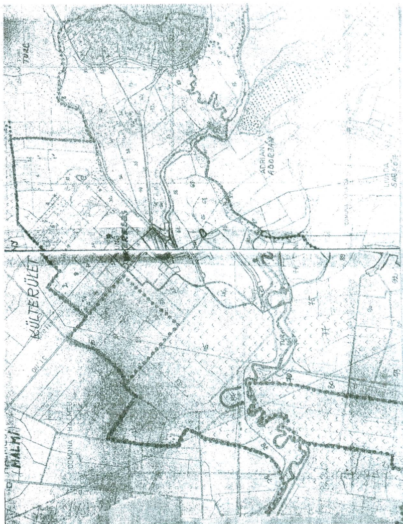
Belterület. A szerző térképe