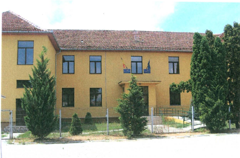
Az új emeletes iskola