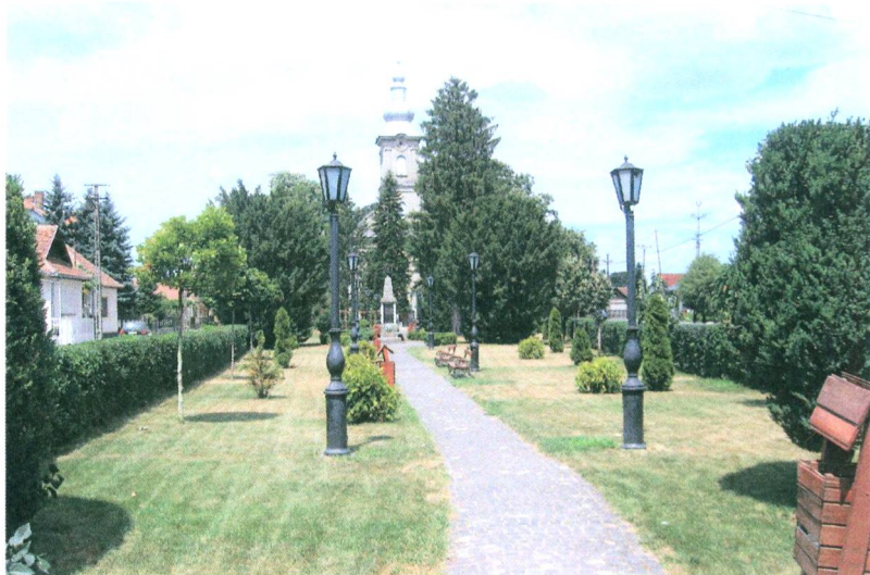
A felújított park