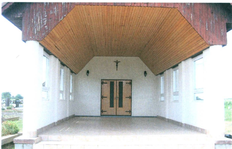
A ravatalozó bejárata