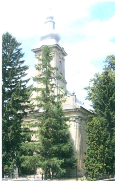
A római katolikus templom