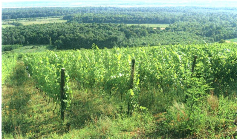
A Mike-domb szőlőse, háttérben a Weis erdeje