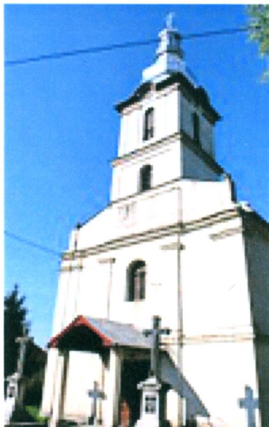
A görögkatolikus templom