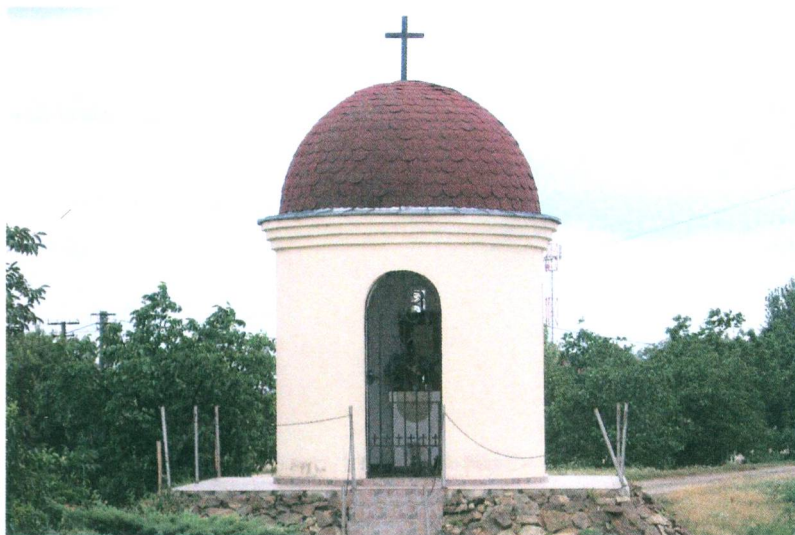
Az új Nepomuki Szent János-kápolna