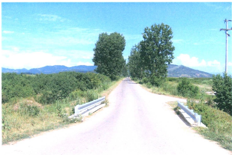
A Hegyi út