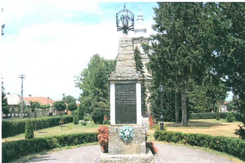
A Hősök Emlékműve a parkban