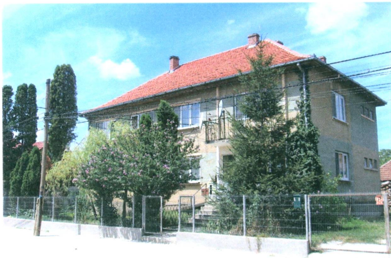
Az orvosi rendelő