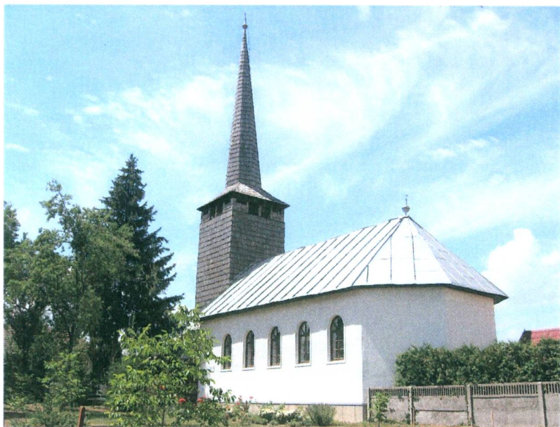
A református templom