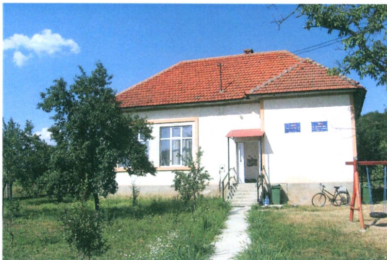
A hegyesi iskola