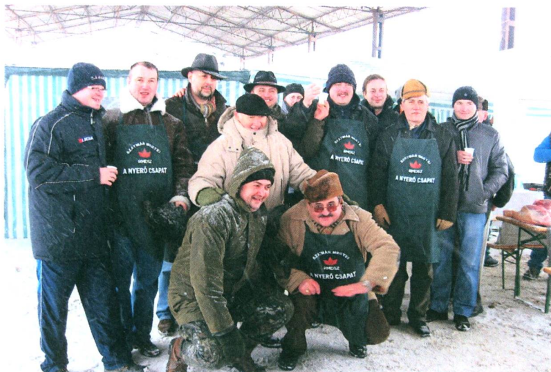
A II. Szatmár megyei Böllérversenynen résztvevő RMDSZ-vezetők