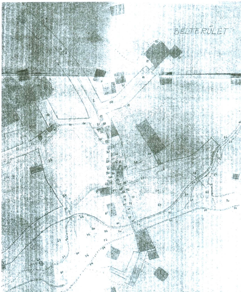
Belterület. A szerző térképe