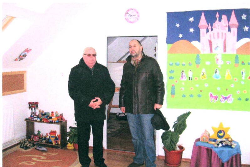
Kelemen Hunor látogatása az óvoda épületében