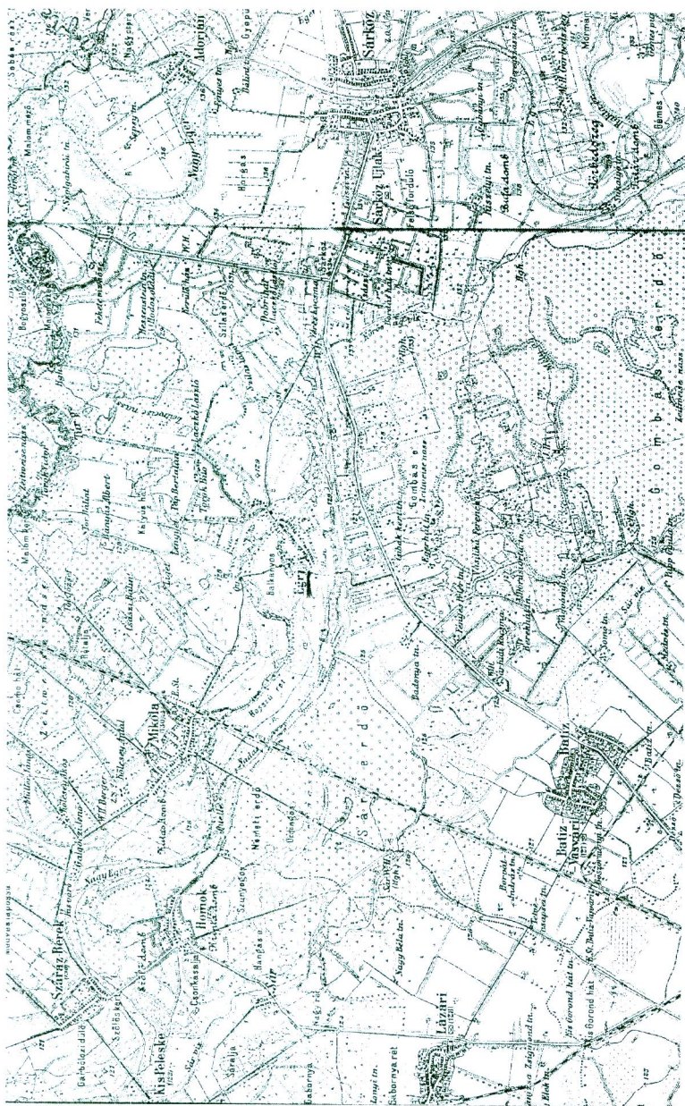
1884. évi térkép