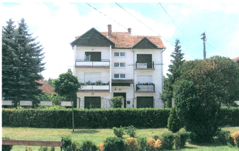
A római katolikus parókia