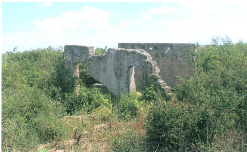
A régi malom romjai