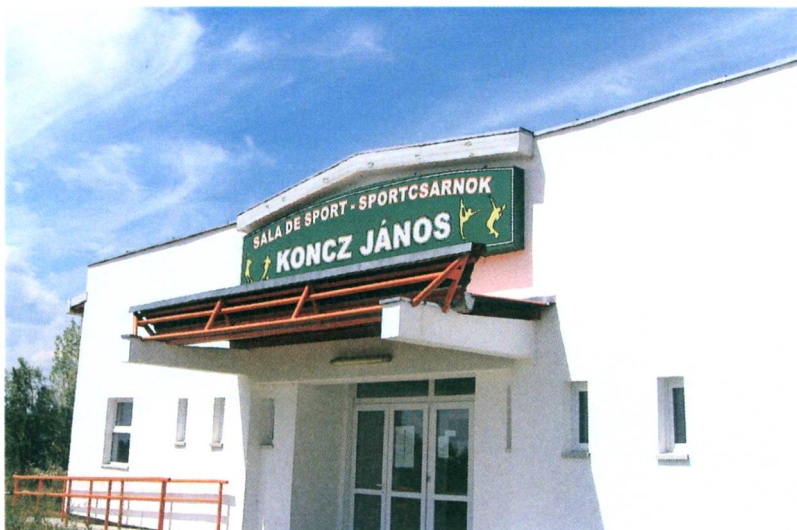
A Koncz János Sportcsarnok