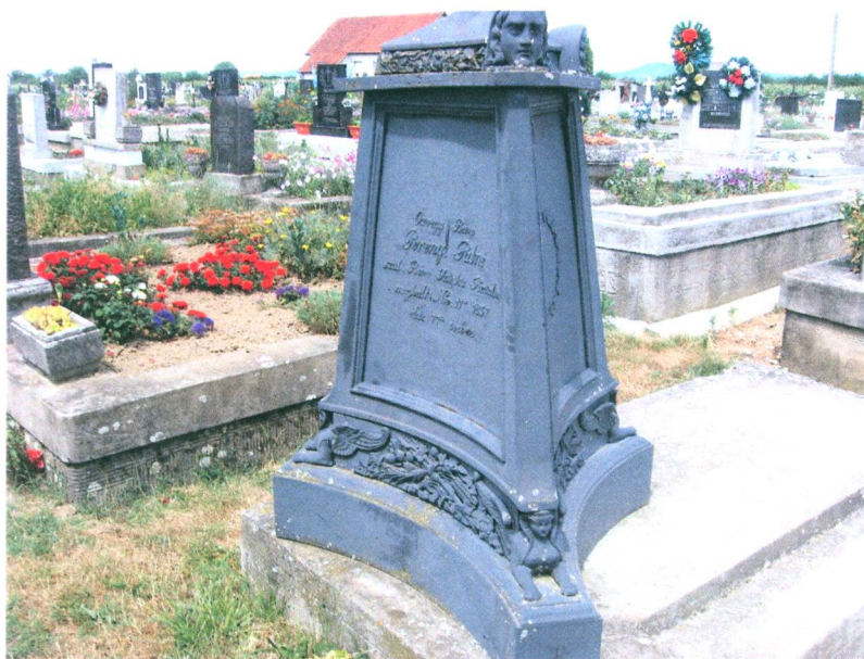
Perényi Pálné síremléke a temetőben