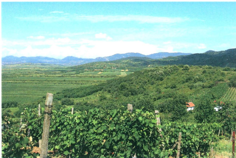
Látkép a Kis-hegyről