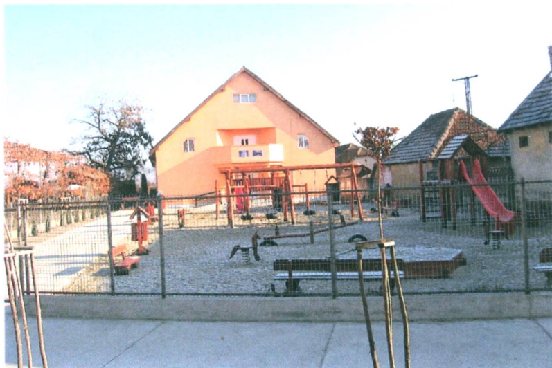
Az új óvoda