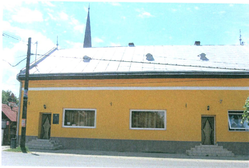
A volt református iskola