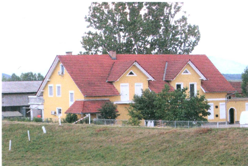
A volt csárda, ma Bauer-pékség