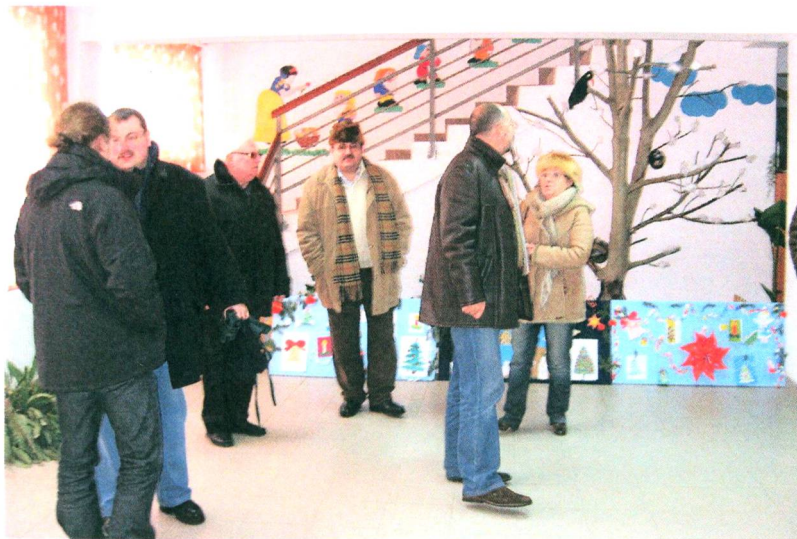
A vendégek megtekintik az új létesítményt