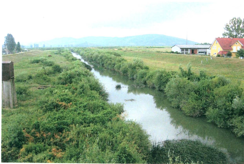
A Túr medre a hídról