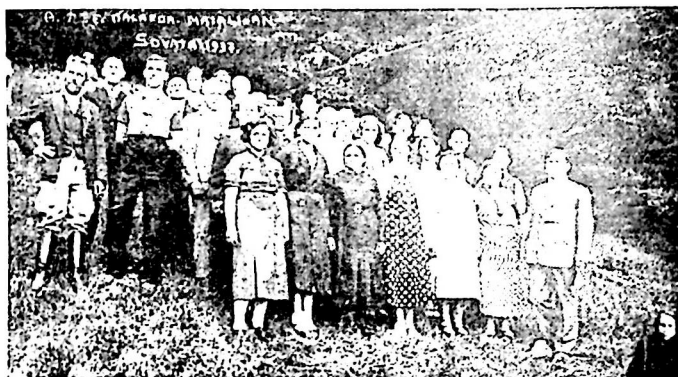
A református dalárda majálisa a furdón 1937. május 8-án.