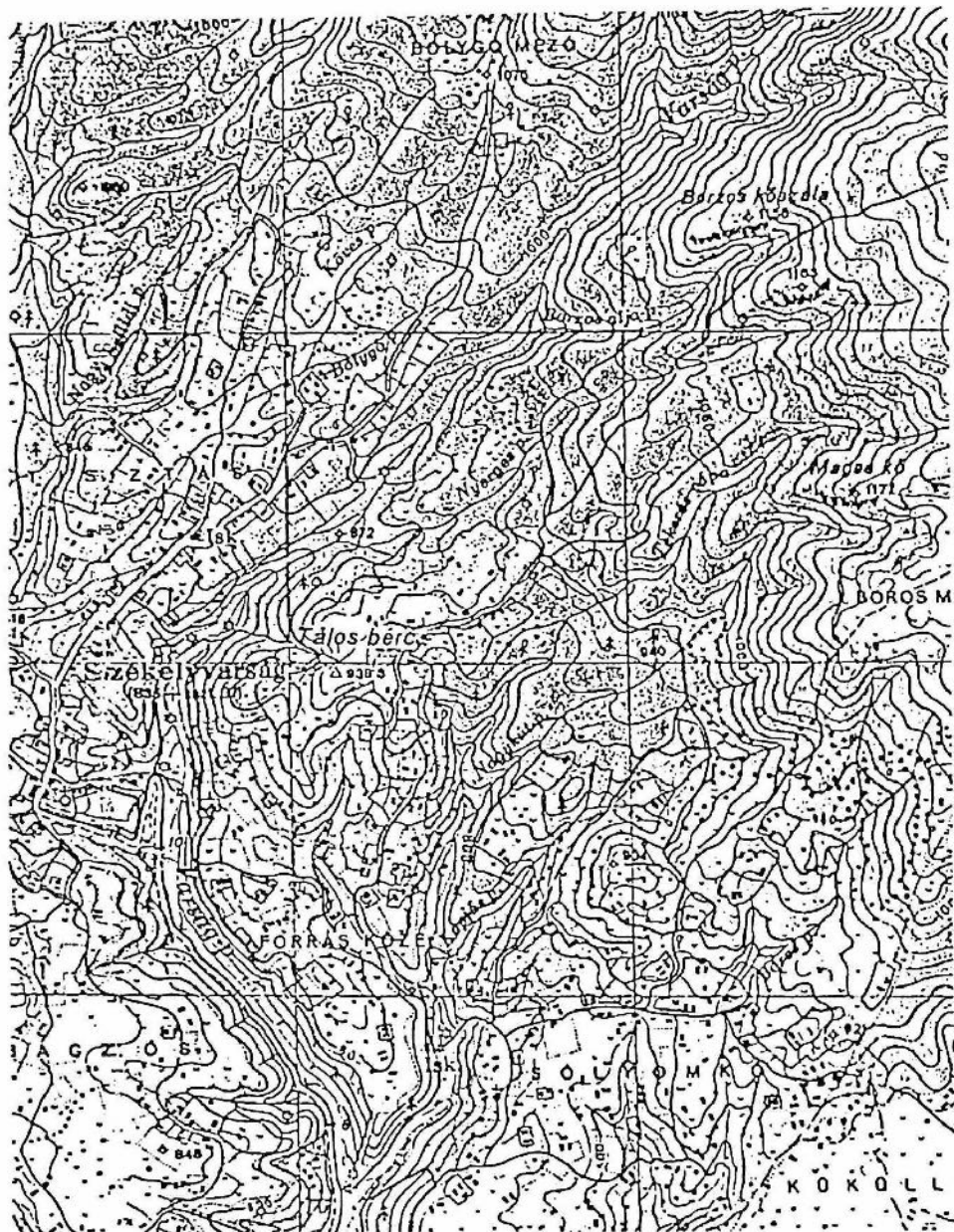
8. ábra. Varsági részlet az 1943. évi állapotokat tükröző, 1944-ben kinyomatott katonai térképfelvételen. (HIT. 5375/Ny. alapján).