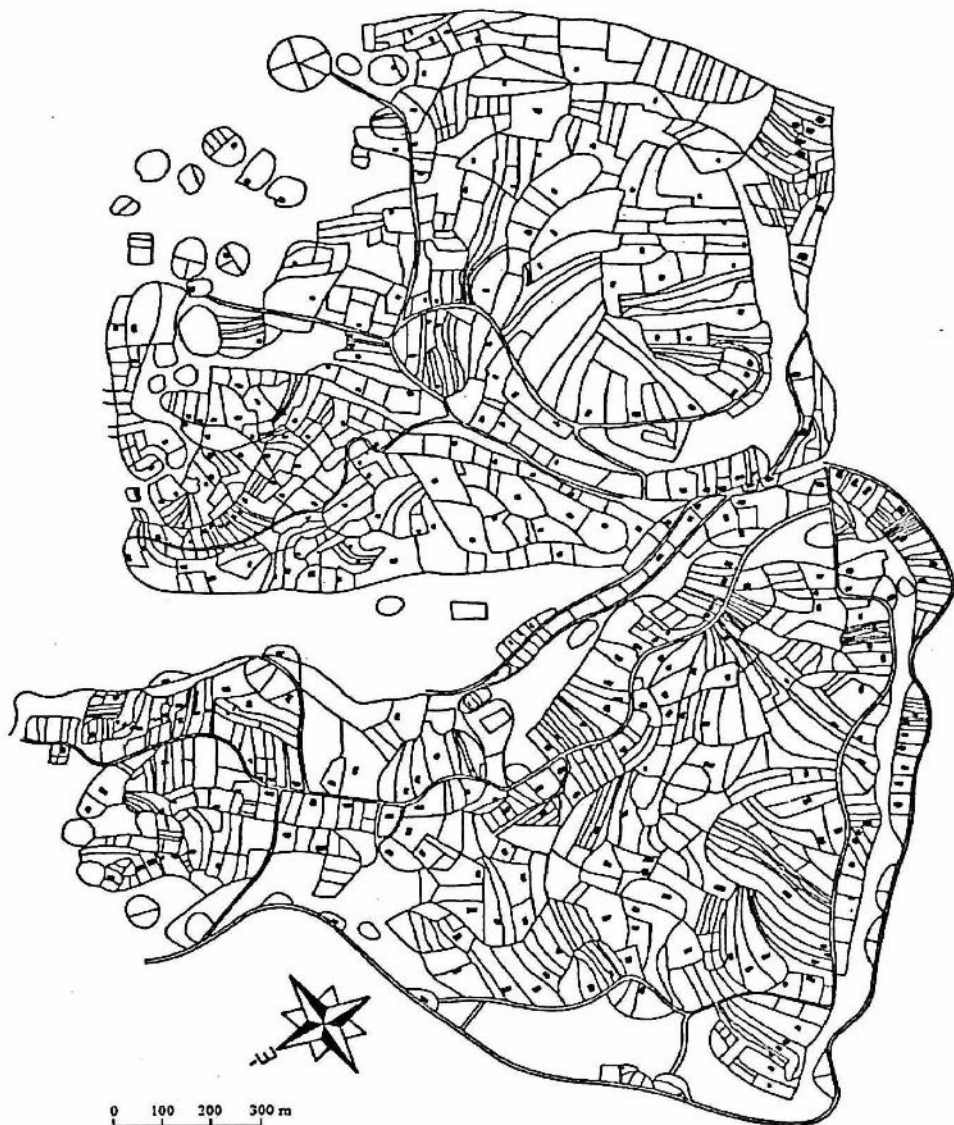
5. ábra. Határbeli paraszti gazdasági telephelyek és állandóan lakott tanyák Varságban 1930-ban. (A VAKI kataszteri lapjai és 1930. évi telekkönyve alapján tervezte: Bárth János. A részletrajzok összeillesztése Fekete Róbert munkája).