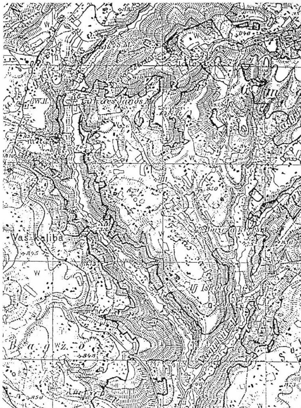
7. ábra. Varsányi részlet az 1882-83-ban készített ún. harmadik katonai térképfelvételen. (HIT. 5374/4., 5375/1., 5375/3. alapján).