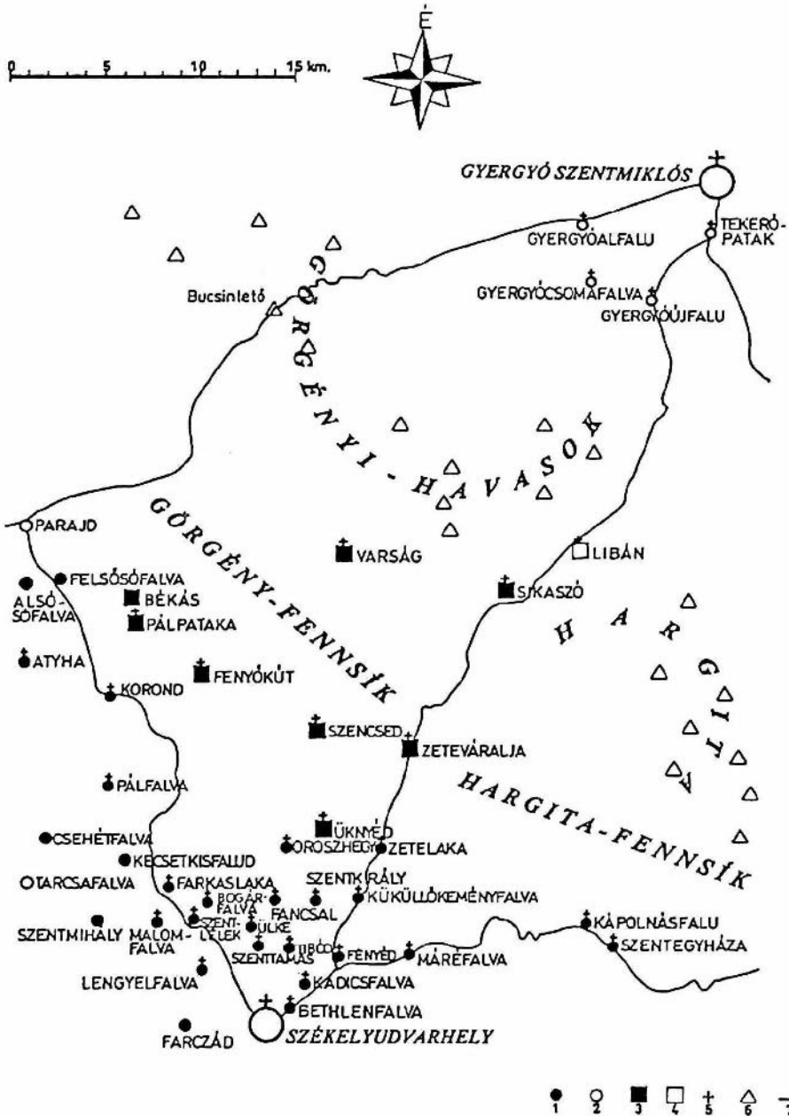
2. ábra. Az udvarhelyszéki Havasolja és környéke. (Tervezte: Bárbh János). Jelmagyarázat: 1. havasolji történelmi falu, 2. környékbéli város és falu, 3. havasolji falu hegyi tanyáinak újabb faluszeű központja, 4. gyergyói helység hegyi tanyáinak újabb faluszeű központja, 5. római katolikus, illetve többségében római katolikus (Korond) népességű település, 6. havasi hegycsúc, 7. országút.