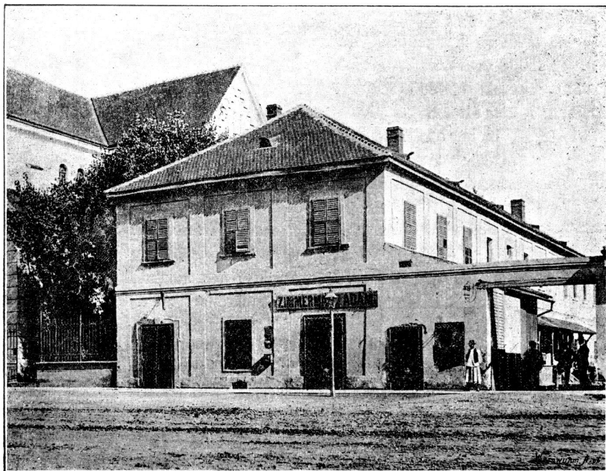
A szentannai convictus.