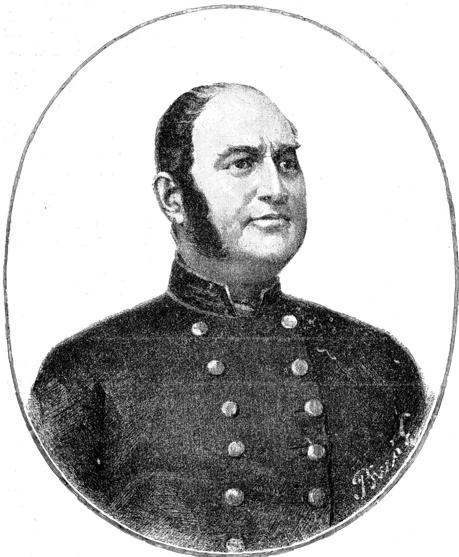
Damjanich János (cs. és kir. kapitány korában).