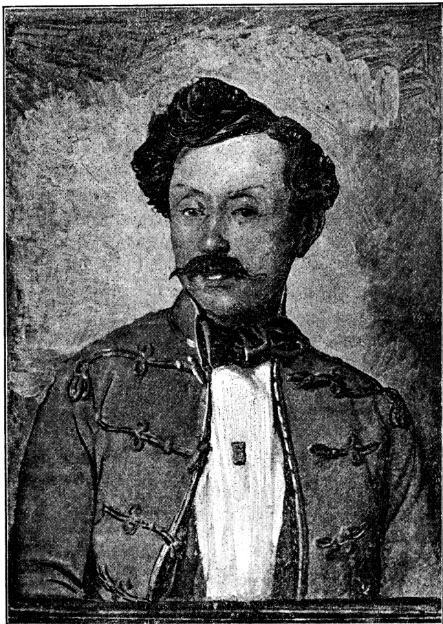
Báró Vécsey Károly.

Míg maga Vécsey ápril 15. az ostromló seregnek, sőt a mérnökkarnak is nagy részével 1) Temesvár alá vonult, hogy az itteni munkálatok ideje alatt annak zárlatát vezesse, Margitay 2 század honvéd s egy tartalék fedezete alatt néhány utászszal és máramarosi bányászszal s 800 munkással ápril 22.-én éjjel 9—10 óra tájban fogott nehéz földadatához. Éjfélután