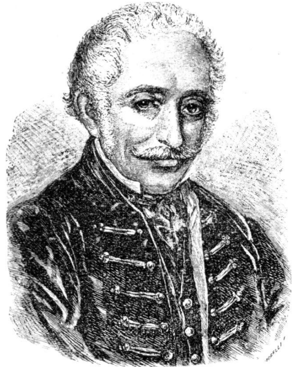
Gróf Wenckheim József.

Poharazás közben barátokat szerezve eszméinek, azonnal munkához látott. Beútaza az egész vármegyét, számba vett minden panaszt és óhajt,