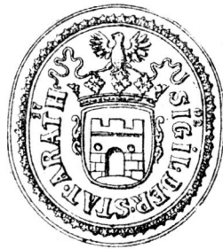
Arad pecsétje, 1702.