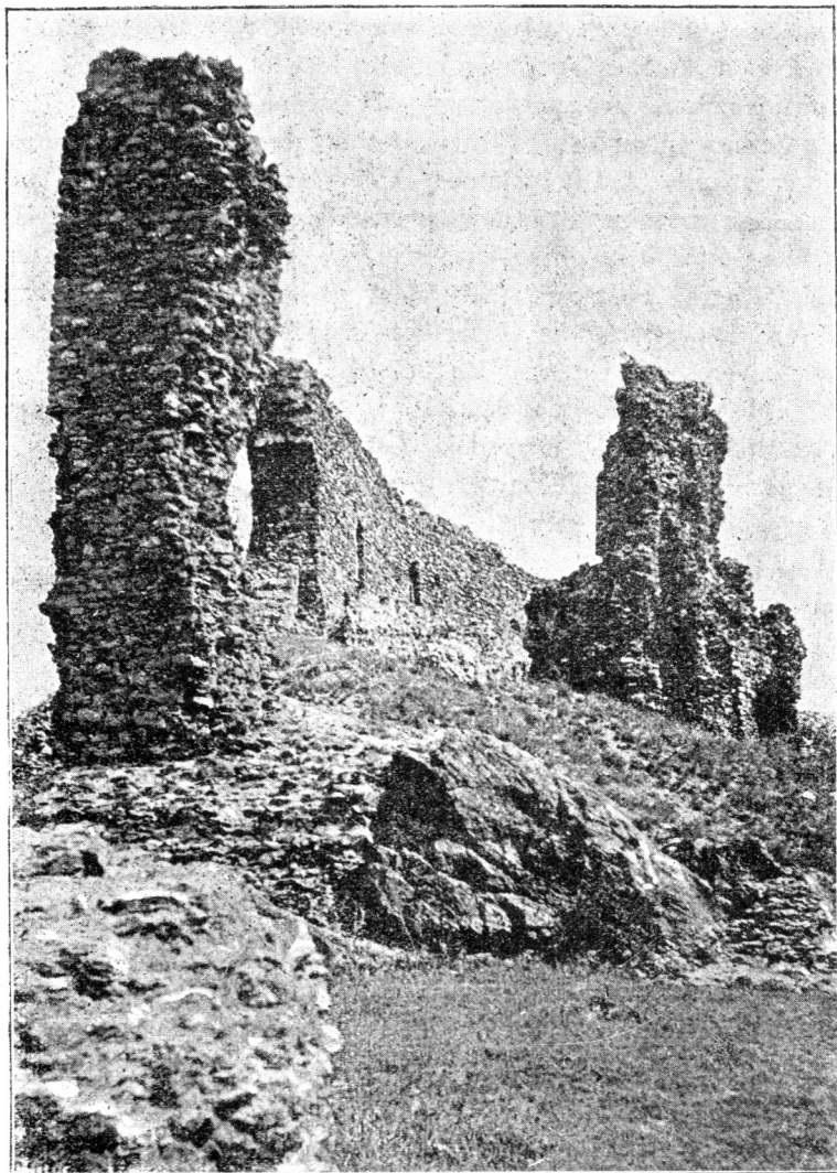
Részlet Világos romjaiból.

A katonaság megjelenésére a Marosvidék is megtisztult a lázadók-tól. November 14.-én a Radna és Petris közt való falvakból egész csapatot hajtottak be Aradra a vármegye börtöneibe 1) , melyek csakhamar megtelvén, a vármegye már nov. 17.-én kénytelen volt megkérni Günther