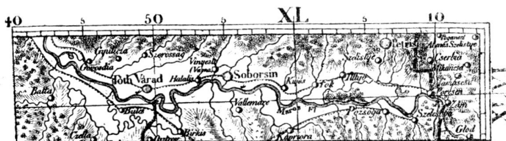
Arad délkeleti része Lipszky térképén.