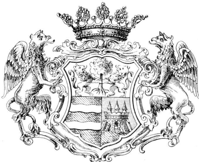
Aradvármegye címere 1767.

A királyi biztosok Aradon 1750. nov. 5. végezték be a visszacsatolás munkáját. Aradvármegye közgyűlése nov. 7.-én örömmel vehette tudtúl, hogy az 1741: XVIII. t.-cz. immár teljesen végre van hajtva, mert a királyné visszakebelezte a marosi és tiszai határőrseget, csupán a csajkások részére tartván fenn néhány helyet. Az aradi járás Solymos, Pau-