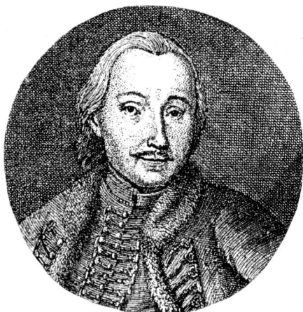
Gróf Grassalkovics Antal.

S most sajtáságos jelenet következett. A tisztikar, élén az alispánnal, a főispánhoz járult és sorban kezet csókolva , magukat kegyeibe ajánlották. Hová lettek azok a büszke kis királyok, kik egészen III. Ferdinánd idejéig jogot tartottak hozzá, hogy kezet fogjanak az országgyűlésére közéjük jövő királylyal, ki csak első a hasonlók közt! A kézcsókkal azután véget is ért e napra a közgyűlés. A rendek a minoriták templomába vonultak, hol szintén »bámúlatos nagy tömeg« gyűlt egybe a