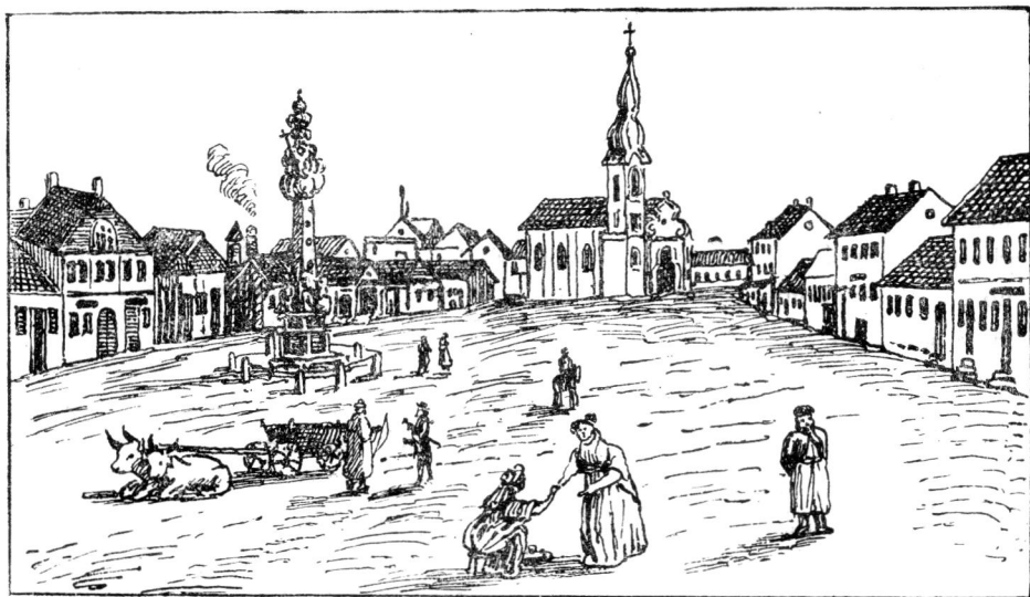
A Szentháromság-szobra Aradon (1828.)