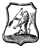
Bocskay István czimere.