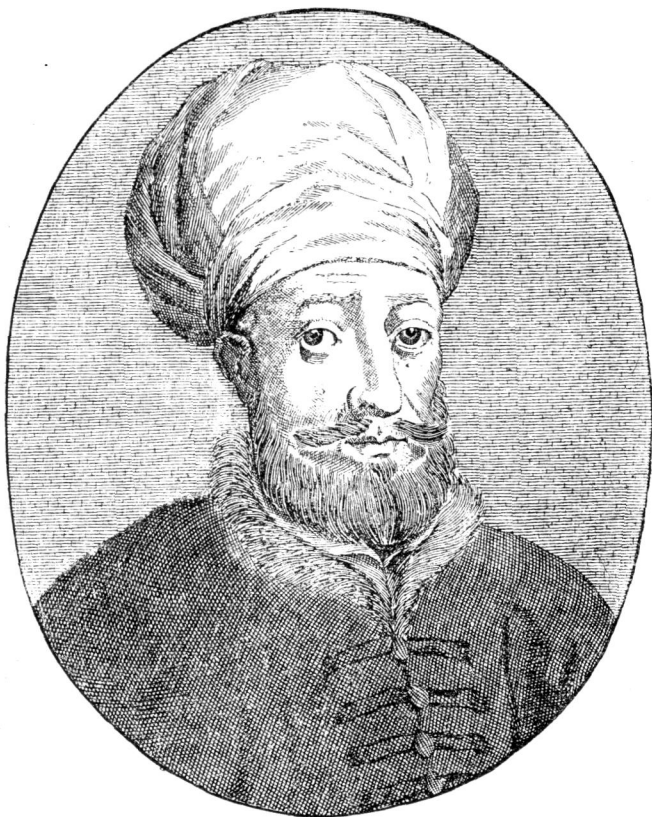
Kücsök Mehmed jenei basa.

»mivel az erdélyi birodalomnak majd nagyobb része Váraddal, Jenővel, Lugossal, Karánsebessel az országtól elszakított s az ország is elpusztult, törekedjék a szegény ország mellett; az adó szállíttassék alább, a szegény ország tovább immár ne bántassék. . . « 1) Jenő, Deszni 2) , Halmágy váraival Zaránd s azokon kívül Bihar- és Szörényvármegyék is jobbadán ezekben az időkben jutottak török kézre. »Oh, boldog Isten!« — sohaj-