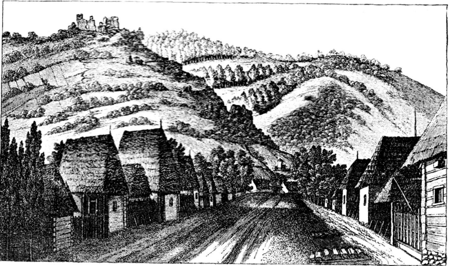
Deszni (Dézna) vára.

lehet« — szólt Murád szultán a temesvári basához és intézkedésre utasította őt 1) . A következő (1576.) esztendőben, mikor Békes Gáspár hadai már régen szétfutottak, s István fejedelemből lengyel király lett, — a temesvári basa még mindig felhánnya Báthory Kristóf fejedelemnek, hogy Deszni közelében a deszni porkoláb a váradi kapitány megbízásából új kastélyt akar építtetni s hogy az ehhez szükséges vesszőket és a palánknak való karókat s egyéb fákat a környéken levő falvak népségével hordatja be; holott Deszni városa 25 esztendő óta 2) a jenei cseribasa tímárja s a Desznihez tartozó falvakat is már régen szétosztották egyes szpáhiknak és bégeknek, úgy, hogy azt az uradalmat a törökök maguknak tartják. A fejedelem alattvalói különben is sok dúlást és gyilkosságot követnek