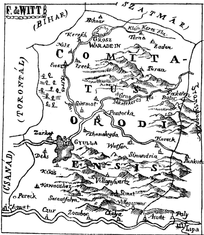
Aradvármegye egy XVII. századbeli térképen.

A megyegyűlést ősidők óta a főispán, kivételkép a király valamely megbízottja hította össze. Aradban tagjai voltak az aradi, bizerei, bulcsi apátok, az alább felsorolandó nemzetségek tagjai, a köznemesek, sőt — az Árpádok korában — a várőrök, udvarnokok és várnépek is. Az 1298: 32. t.-cz. mindenkire kiterjesztette a megyei hatóságot; s az 1351. országgyűlés kimondta, hogy nemesek ellen törvényes vizsgálatot csak a megyegyűlés tarthat. — Ha a tömérdék kivételt csupán az 1495: 15.