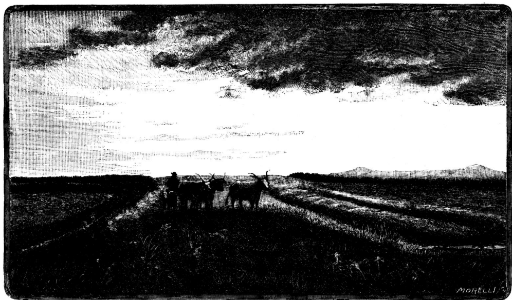
Római sáncz a szabadhelyi határban.

Daciának ezen külső limese, mely egészben véve mintegy négyszáz kilométer hosszú, Aradmegyében 60 km-ternyi vonalra terjed s így az egésznek 15 0 / 0 -ára. Talán nem készült egységes terv szerint s nem is épült ki mindenütt; a castrumok építését alkalmasint legutoljára, oly időre