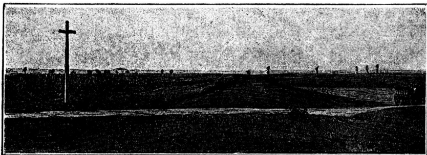
Római sáncz a szabadhelyi határban.

sem ritkán találunk. A töltés azután tovább megy Gyorok, Kúvin, Kovaszincz és Világos felé, hol a belső limestől kissé nyugatra hajolva, egyenesen éjszaki irányt vesz. A nép úgy tudja, hogy ez árkok Orsováig haladnak s hogy régen Erdély határát képezték. Világos, Zaránd és Szintye közt már teljesen elmosódtak a leszántott sánczok. Szintyén, illetőleg a Fejér-Körösnek jobb partján levő somosi erdőn túl azonban már két töltést is ösmer a nép s azt fölváltva (egy és ugyanazon irányban is) Trajánnak és Ördögárkának nevezi. A nyugati, úgy látszik, csupán a két Körös összekötésére szolgált. Szépen fennmaradt a horgostói és a csereklyési határrészben, honnan a római éremleleteiről ösmeretes Livadia-pusztá és Tamásda felé megy tovább. A másik, fő vonal, Szintyétől éjszakra s Ágyától keletre, az ágyai erdő és Sáros-zug közt feltűnő épen maradt meg. Itt Ördögárok, a Holumbár-erdőben pedig már Traján a neve 1) . Majd Szalonta, Inánd, Püspöki és Siter felé folytatódik a sáncz s a Rézhegységen keresztül lépve, Ákosnál (Szatmártól délre) a Kraszna folyó baloldalán nyoma vesz.