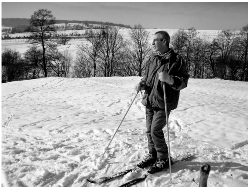
Lesiklás előtt (Uzonka, 2007. december)

optikusan látja az ember, néha elkerülhetetlenül hunyorog. Viszont cserébe a látás zavaráért, egyszerre van jelen mindkét térben és idősíkbán.