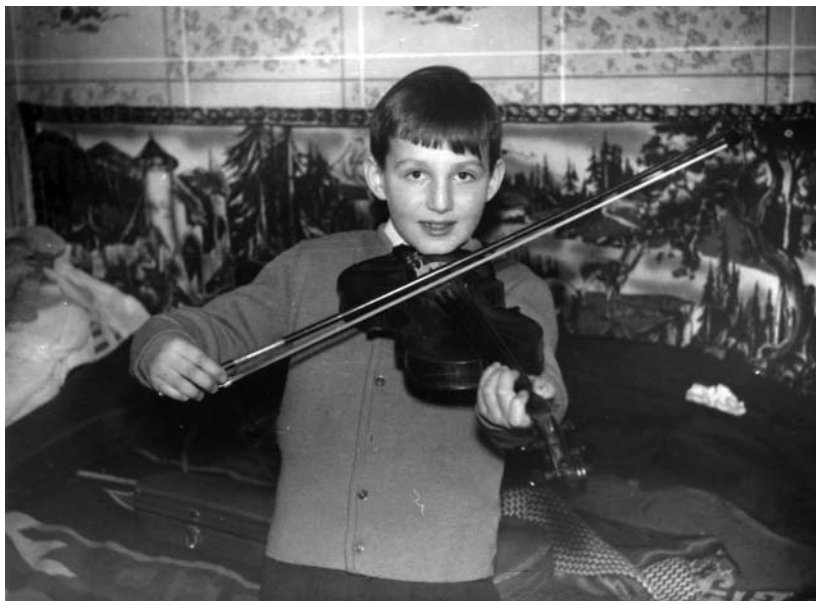
Mesterien tartja a vonót, habár hegedülni soha nem tanult

Hát, akkor zenéljünk, Főnök! Didergő lélekkel, vagy virtuóz eleganciával, mindegy. Remélem, odaát is csak az a fontos, hogy a dallam ne legyen hamis.