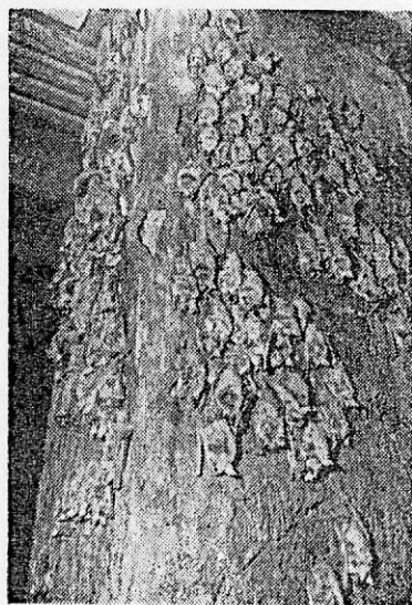
Fig. 7. Modul de fixare a liliecilor pe pereții coșurilor; (fiecare individ vine în contact cu zidul cu toată partea sa ventrală)