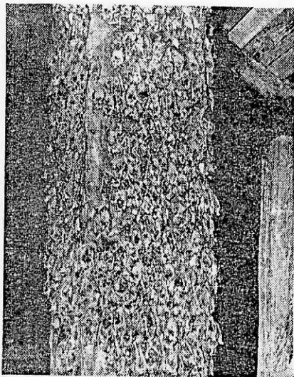
Fig. 4. Colonia instalată toată pe pereții coșurilor (temperatura = 33° C).