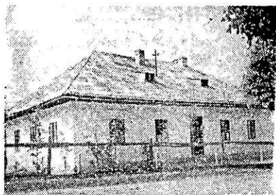
Fig. 1. Vederea generală a școlii în podul căreia se adăpostește o colonie de Myotis myotis . (Școala generală Dărmănești-Suceava)