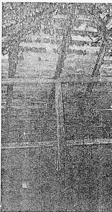
Fig. 5. Colonia instalată în partea cea mai de sus a acoperișului (temperatura = 20° C).