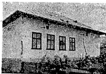
Fig. 2. Cele două intrări din partea de sus a peretelui sudic al școlii