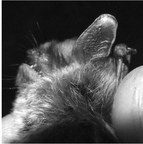
Figura 3 Myotis alcaethoe – exemplar capturat în Cheile Vârghișului.