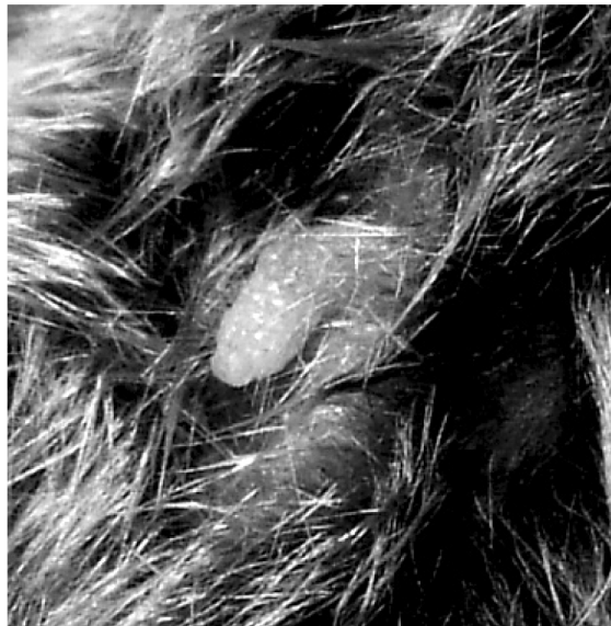
Figura 5 Forma penisului.