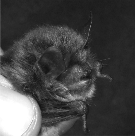
Figura 2 Myotis alcaethoe – exemplar capturat în Cheile Vârghișului.