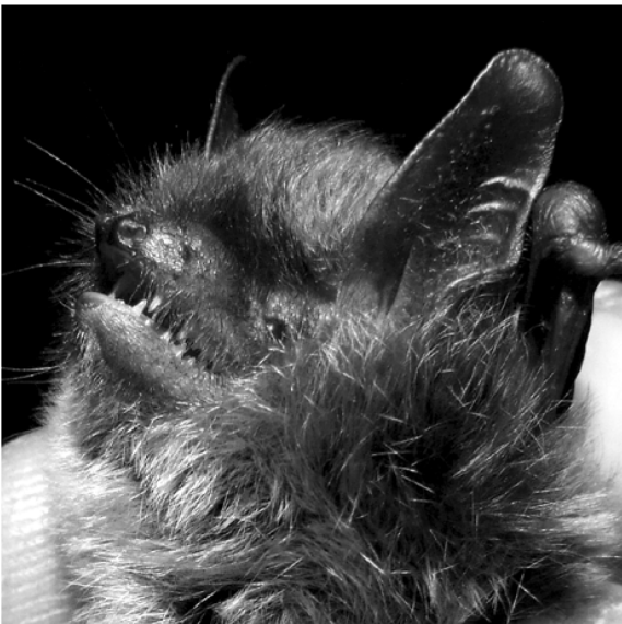
Figura 4 Forma tragusului și a nărilor la exemplarul capturat.