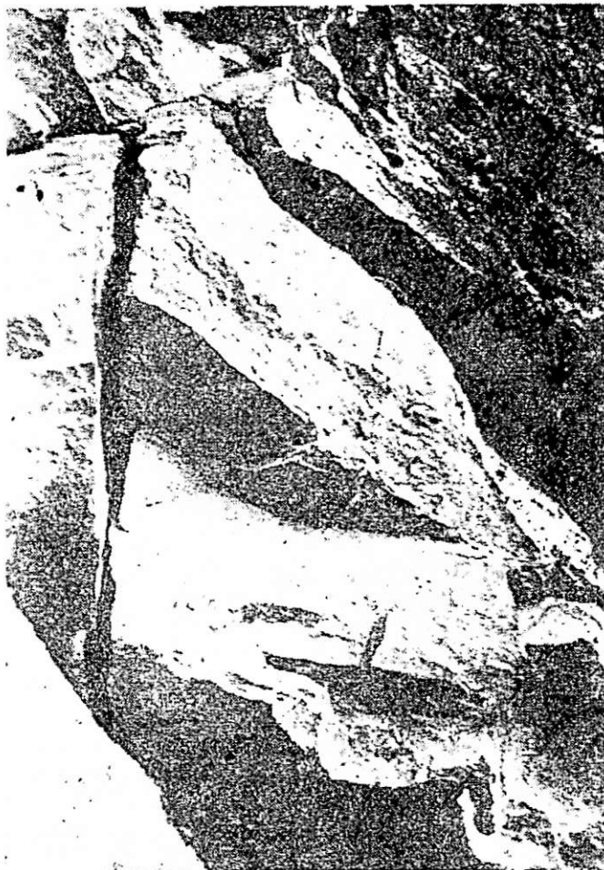
Fig. 2. — Fisură lărgită ocupată de lilieci din colonia nr. 4

În afară de coloniile citate, în câteva crăpături mai mici ale falezii am mai găsit câte 2—5 indivizi morți, fapt care arată că hibernarea în număr mic într-un astfel de microbiotop are urmări negative pentru aceștia, când temperatura scade prea mult. În unele crăpături mai mici am găsit schelete vechi de N. noctula ; acestea apar chiar în adăposturile coloniilor citate, agățate pe pereți sau căzute la partea inferioară a lor.